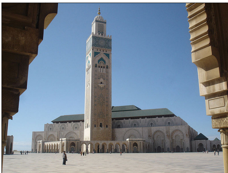
The Hassan II Mosque, Casablanca